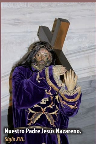
Nuestro Padre Jesús Nazareno. Siglo XVI.