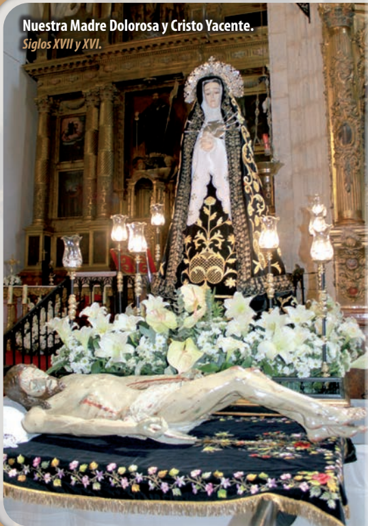
Nuestra Madre Dolorosa y Cristo Yacente. Siglos XVII y XVI.