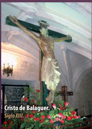
Cristo de Balaguer. Siglo XIII.