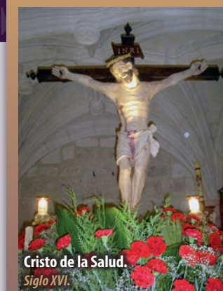
Cristo de la Salud. Siglo XVI.