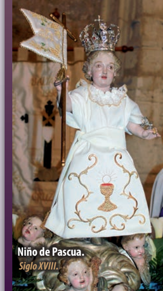
Niño de Pascua. Siglo XVIII.