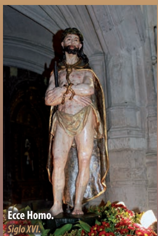
Ecce Homo. Siglo XVI.